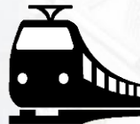
Железнодорожные пути необщего пользования