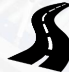
Дорожная инфраструктура (автомобильные дороги)